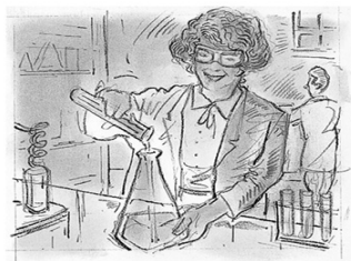
Mélanie: 7:45, 😊

6 Write a conversation between Mélanie and Alexandre in which they ask each other what time they have these classes and their opinions of them.