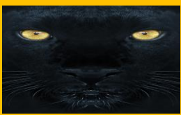
Escuelas de Sumter SCOOP!