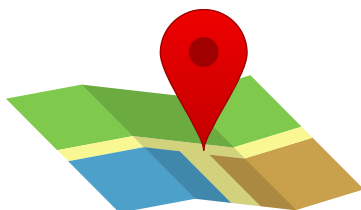
Comprobante de domicilio