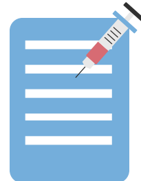
Registro de vacunación

Para los que califiquen según sus ingresos: